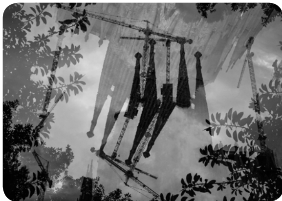
Experimente verschiedener Art schulen das Auge und wir nehmen neu wahr. Hier die Sagrada Familia.