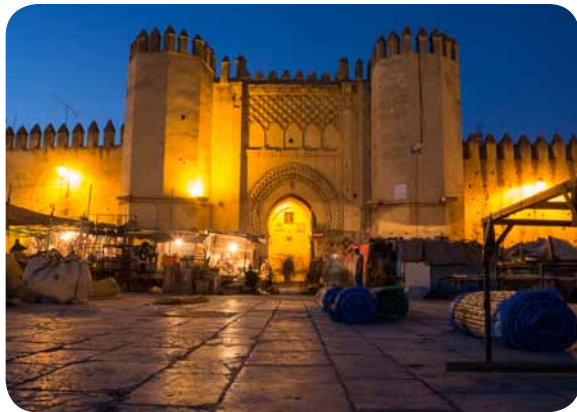
Das einfache Leben, morbide Tore und Paläste erzählen stumm von alten Zeiten.