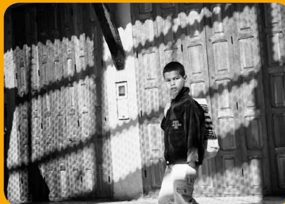
Hintergründe erkennen und einplanen, Licht und Schattenwurf beobachten, mit Kontrasten arbeiten.

Im Patio unseres Riads werden wir die Ergebnisse analysieren. Unser Augenmerk liegt dabei in der gelungenen Bildkomposition und der grafischen Qualität der Fotos. Die Teilnehmer sollen eine kreative Fotografie realisieren und den Blick für den „einzigartigen Moment“ (H.C. - Bresson) schulen.