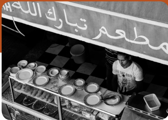
Ungewöhnliche Perspektiven und Ausschnitte sind unter anderem Inhalt der Streetfotografie.