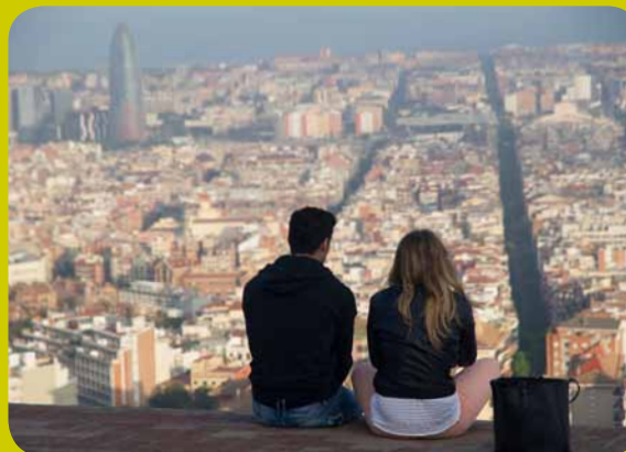
Auf dem Tibidabo mit seinen kontrastreichen Ausblicken auf die faszinierende Stadt am Mittelmeer.

Der Kurs richtet sich an Anfänger und Fortgeschrittene der Digitalfotografie. Die Teilnehmer lernen den Umgang mit Blenden- und Zeitautomatik, sowie manuellen Einstellungen. Bei der individuellen Betreuung geht Carola einzeln auf die Teilnehmer ein und gibt Tipps für bessere fotografische Resultate.