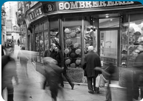
Streetfotografie: Es wuselt nur so und wir üben, Menschen unbeobachtet einzufangen.