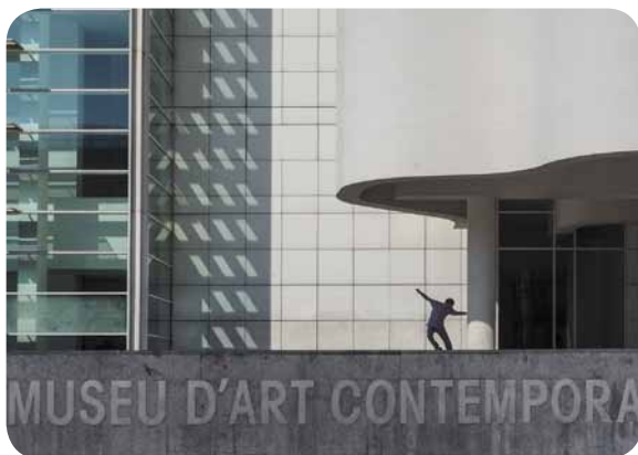
Die Elemente der Bildgestaltung lernen und neu wahrnehmen. Hier ein Skater am Museum MACBA.